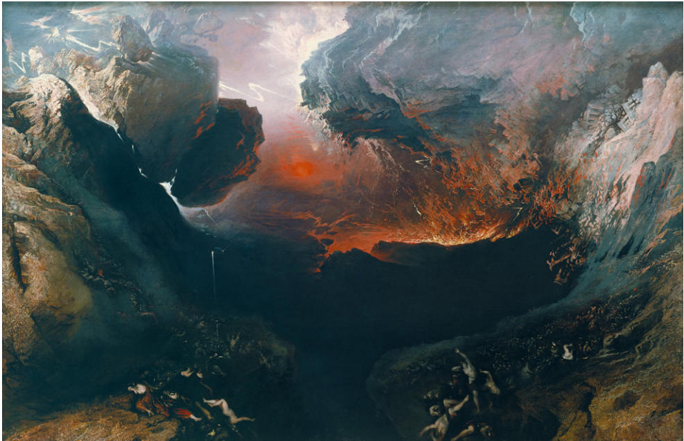
De apokalyptiske forestillinger lever i bedste velgående. Særligt tidens klimaudfordringer har revitaliseret ideen om en forestående dommedag. Her skildret ved John Martins pensel i The Great Day of his Wrath (1851).

temporary museum as an active agent in shaping the world around us and making it a better place for all. 89