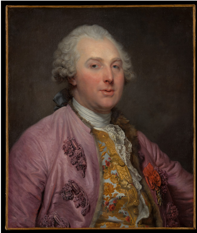
Charles Claude de Flahaut, Comte d'Angiviller. Den gamle verdens museumsmand. De Flahaut var i færd med at modernisere kongens slotte og samlinger, da revolutionen brød ud i 1789. Jean-Baptiste Greuze, 1763.

ud. Det var datidens svar på kongens kulturminister, Charles-Claude Flahaut de la Billaderie, der stod for moderniseringen, og denne var meget inspireret af museerne i Wien og Düsseldorf, hvor netop kronologien havde gjort sit indtog. La Billaderies indflydelse standsede brat i 1789 (han flygtede i 1791), og Louvreprojektet blev genoptaget af en ny museumskomité og kom sidenhen i klørne på de mest radikale jakobinere.